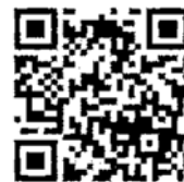
【申込フォーム QR コード】

◇その他:・オンライン会場は、開催前(11月17日(水)AM 予定)にメールでご案内します。