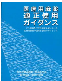
医療用麻薬適正使用 ガイドンス